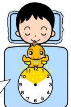
ねむりのゴールデンタイム