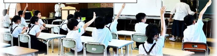
6年生 話をする人への目線!