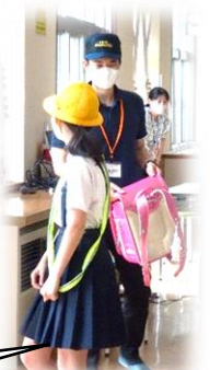
ランドセルを脱ぎ捨て逃げます!