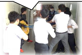
110番通報、警察到着まで先生方が奮闘!