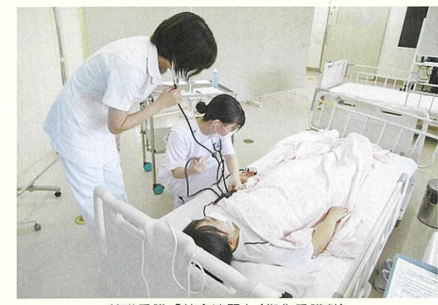
基礎看護「統合演習」（衛生看護科）