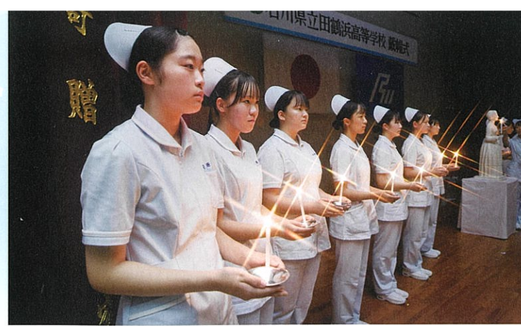
戴帽式（衛生看護科）

田鶴浜高校のカリキュラムは、社会人としての幅広い教養を身につける共通教科はもちろん、将来、看護職、福祉関連職を目指す生徒のために、専門教育に重きを置き、実習など実践的な授業が多彩に盛り込まれています。また、大学・短大・専門学校への進学指導や、資格試験対策などもきめこまかにおこなっています。