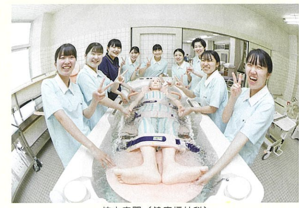
校内実習（健康福祉科）