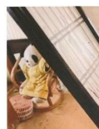
家じゅうの物がたおれた中、たおれたお母とタレスの間に、ちこんとすわっていたパンダちゃん。きせきだと思いました。