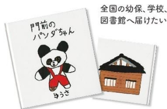
全国の幼保、学校、図書館へ届けたい