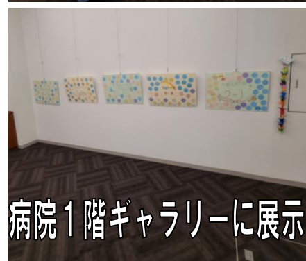
病院1階ギャラリーに展示