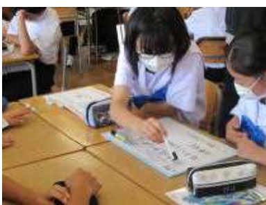
グループでの話し合い①