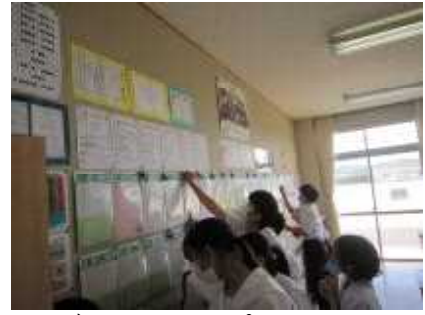
リボンをネームプレートに飾る