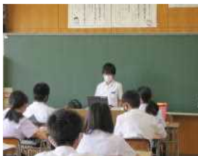
クロームブックを使っでの発表