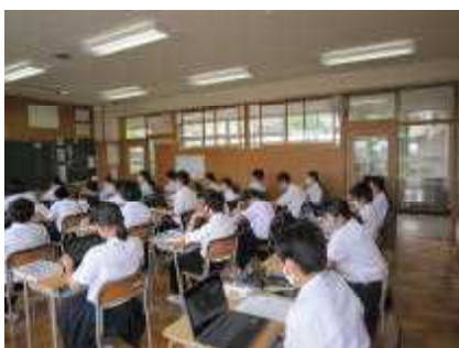
クロームブック活用授業

一方で、授業でクロームブックを活用することが多くなり、学習活動がさらに充実し、様々な発表もそれを使って行うようになってきました。情報通信技術が教育の場に導入され、生徒たちもそれを活用できるための知識と技術を授業を通して学んでいます。また、教室環境が整えられている学級も増えてきました。さらなる授業の充実のために働きかけていきたいと思います。