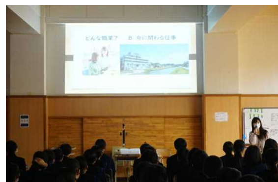
(「働く人に学ぶ会」オリエンテーション)