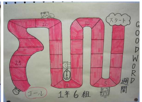
(6組 28マス ◎ゴール)

自分の言葉に責任をもって、過ごすことができました。友だちや先輩、先生に対して、どのような言葉遣いをすればよいのかを考えて言葉を発することができたと思います。GOOD WORD週間は終わったけれど、これからも場に応じた言葉遣いをして、つながりの輪を広げていきたいと思っています。人に言われた言葉で嫌な思いをする人が少しでも減るといいなと思いました。