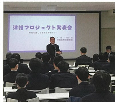
津幡プロジェクト発表会