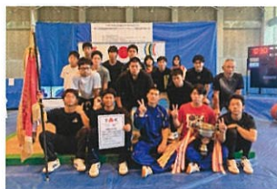
ウエイトリフティング部