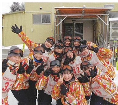
ウィンタースポーツ実習