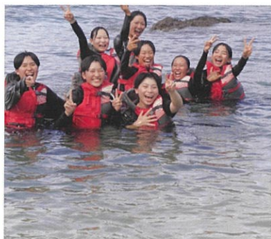
マリンスポーツ実習