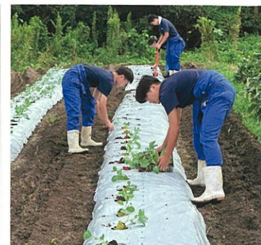
ブロッコリー定植