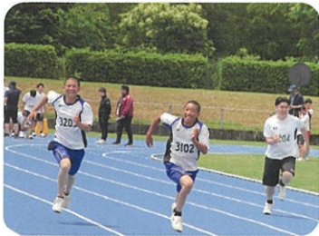
校内陸上競技大会