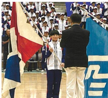
国スポ石川県選手団

スポーツをより科学的に追求し、心と身体の健康について学びます。専門的な知識や高度な技術を身に付けた体育指導者の育成を目指します。地域における生涯スポーツのリーダーを育成します。