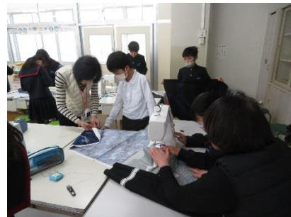
糸のかけなどミシンの使い方や布の裁ち方など丁寧に教えていただきました。