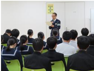
交通違反となる行為の説明を聞いています

登下校時の危機・事故回避のため、学校でも引き続き指導・啓発していきます。ご家庭でも機会を捉え、交通安全・防犯についてお話していただくようお願いいたします。