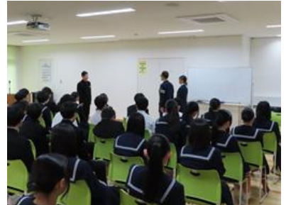
講師にお礼を述べています